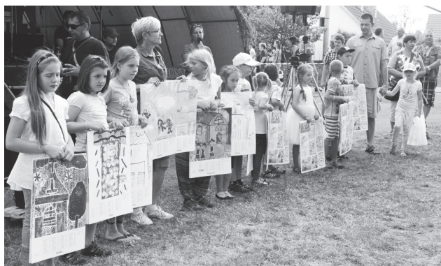
Součástí programu bylo i představení kalendáře s kresbami Kostelíka, které vytvořily děti za školy ve Slabcích.

Kostelík - Skotsko v Kostelíku je rok od roku větší a mohutnější. Letos se počet diváků zase dramaticky zvedl a dosahuje již téměř limitu našich sil i kapacitních možností. Kostelík je sice velký, ale auta parkovala už skoro všude a na návsí, tedy v hledišti, již místy nebylo k hnutí. Skvělý program a velmi dobrá propagace přilákaly stále více a více diváků a to všech věkových kategorií. Na koncert přijeli všichni od nejmenších capartů až po nejzkušenější pamětníky a návěs byla úplně plná již od začátku celého festivalu krátce po poledni. Skotsko v Kostelíku se již pomalu stává mezinárodní akcí, protože kromě diváků z Čech a Moravy jsme mohli potkat i hosty z Rakouska,