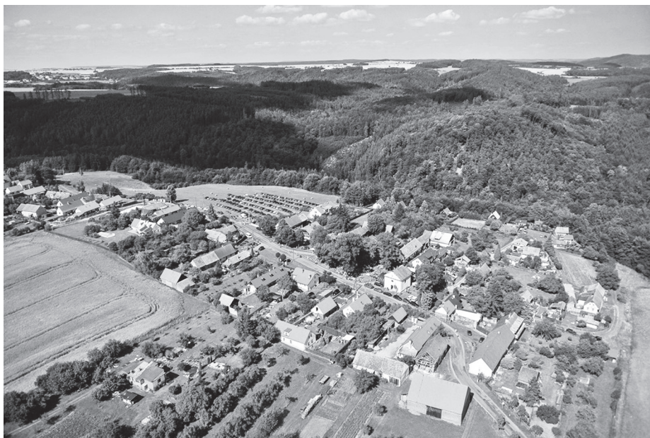
Kostelík z výšky. Jedna z působivých leteckých fotografií pořízených během letošního festivalu Skotsko v Kostelíku. Další snímky najdete na webu OS Kostelík.