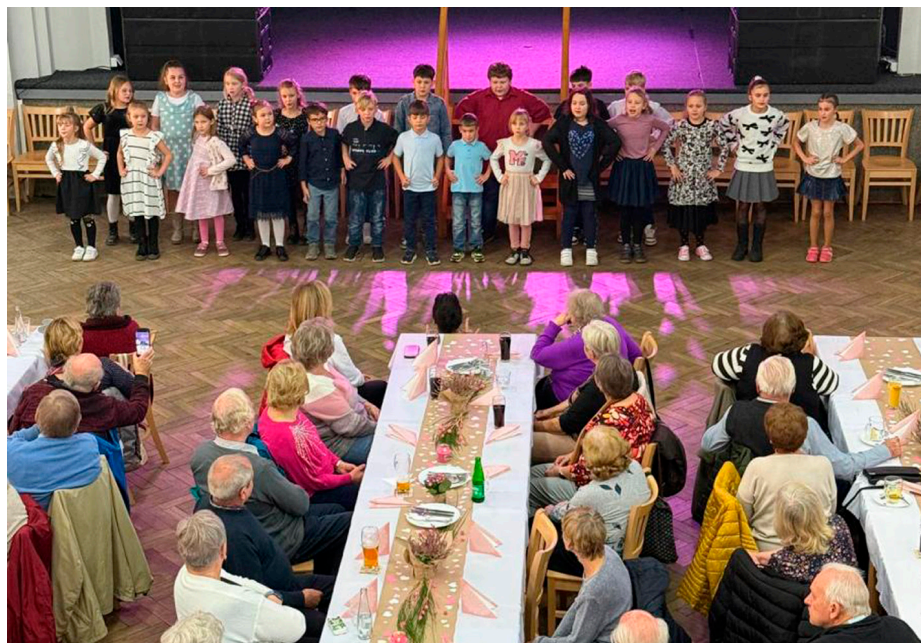
Vystoupení školních dětí pro seniory v KD Slabce.