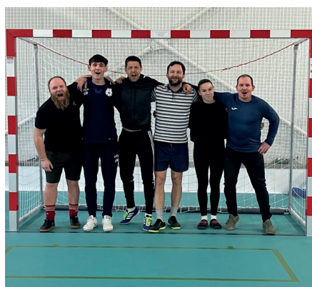
Soustředění v Žihli.

Zimní soustředění splnilo svůj účel a kolektiv dívek se zase více stmelil, celá