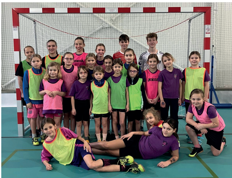
Slabcké Dračice na zimním soustředění.

Slabce ■ Modřejovice ■ Rousínov ■ Svinařov ■ Skupá ■ Kostelík ■ Nová Ves ■ Malé Slabce