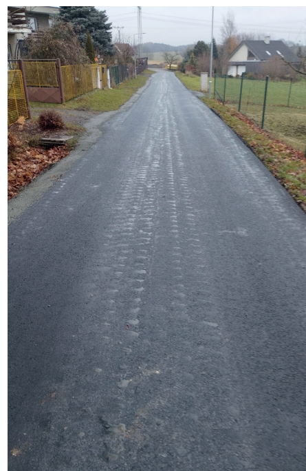
Opravená místní komunikace.

akce byla důležitým krokem v přípravě družstev na nadcházející část jarní sezóny. Velké poděkování patří všem zúčastněným trenérům.